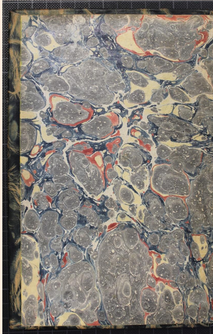
Hoja de guarda